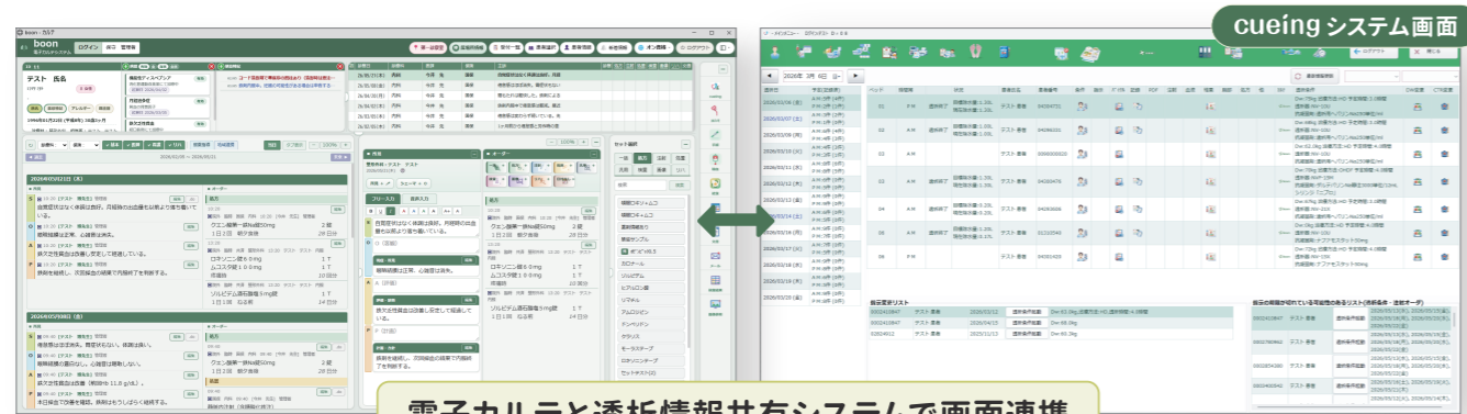
電子カルテと透析情報共有システムで画面連携